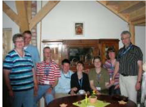
(Die Teilnehmer des Europatreffens aus Hannover)

Montagabend war in Warnemünde direkt am Alten Strom in der Wirtschaft „Bei Wenzel“ für die Langen die Fensterfront reserviert. Für nahezu 200 Lange von Nah und Fern gab es ein großes Hallo und Wiedersehen.