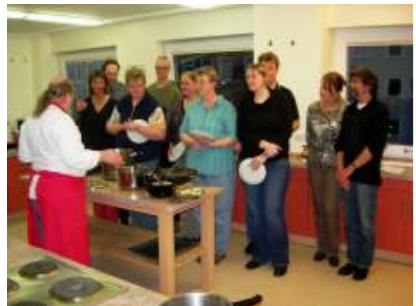
(Ein Foto vom indischen Kochen)

Ab 19 Uhr findet unser nächster Outdoor-Klubabend bei hoffentlich gutem Wetter im Biergarten Wülfel (Hotel Wienecke, Hildesheimer Straße 380) statt. Anfahrt: ☐ 1, 2; Haltestelle Dorfstraße. Dort gibt es unter anderem Rippchen und einige kühle Getränke.